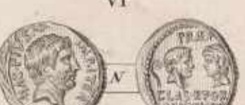
Médaille Romaine de Pompée représentant la tête du grand Pompée et sur le revers l'effigie de César sur deux fils.