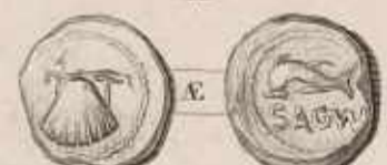
Médaille de Sagonte de l'époque avec les initiales S.A.G. Caractères Latins. Déterminés de la République Romaine.