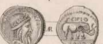
Médaille Romaine de la famille Cornélie avec le nom de Sagonte.