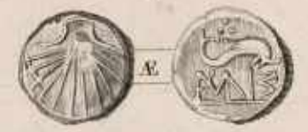
Médaille de Sagonte de l'époque avec Caractères Celtibériques. Exécuté par Fabrice, maître de la Monnaie Royale et fondateur de Sagonte.