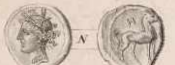
Médaille de Carthage avec Caractères Phéniciens. Annulation postérieure de Carthage.