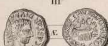
Médaille de Sagonte de l'époque avec les initiales S.A.G. et l'effigie de Tibère. Déterminés de l'Empire Romain.